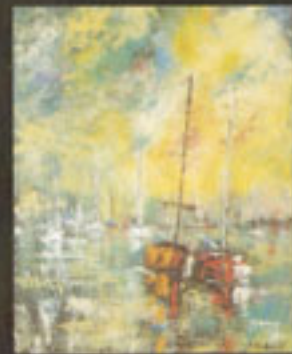
"Marine Verte" H.S.T. 81 X 65 cm

Estimation moyenne à la vente > 100 € le point