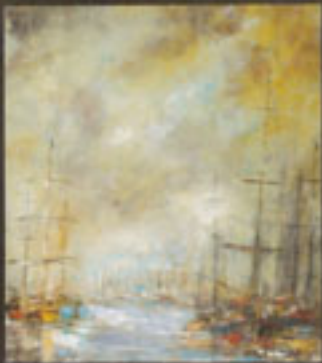
"Vieux Gréements" H.S.T. 100 X 81 cm