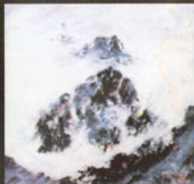
"Pointe du Raz" H.S.T. 100 X 100 cm

Estimation moyenne à la vente > 100 € le point